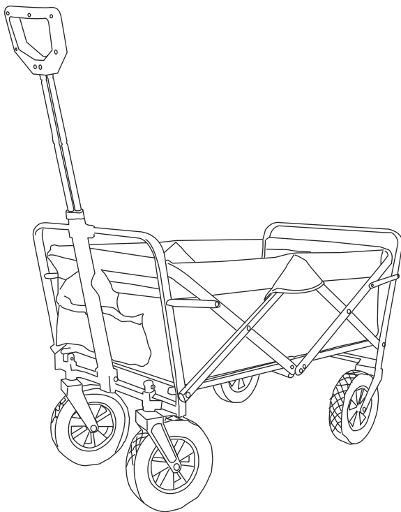
Sekey 3114 Folding Wagon